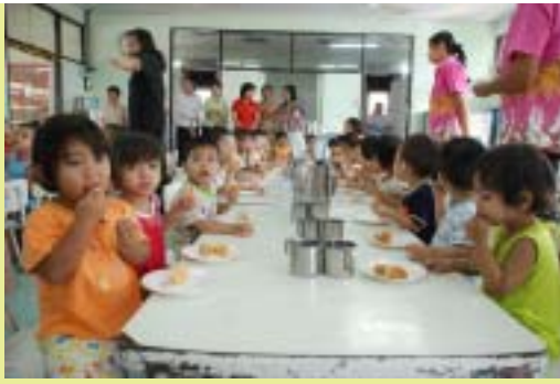
สภาข้าราชการ มหาวิทยาลัยธรรมศาสตร์ จัดพิธี